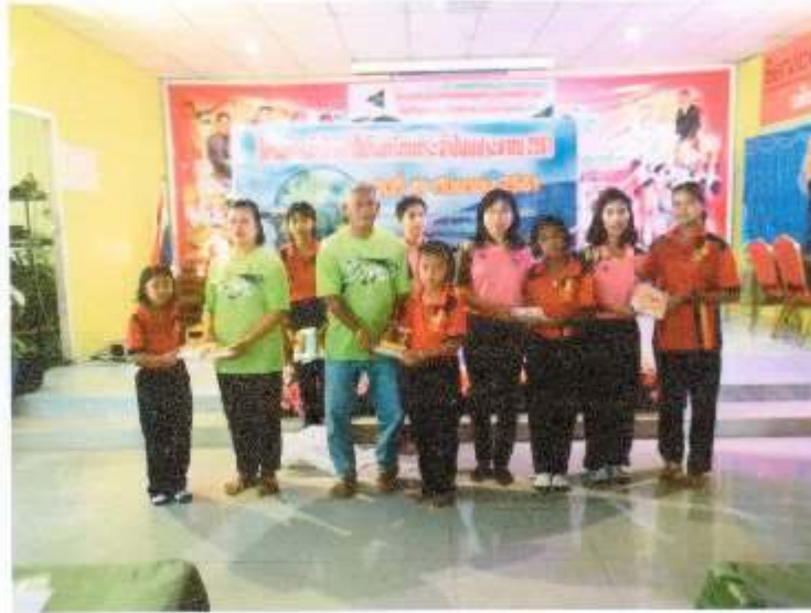
ตัวแทนรับมอบอุปกรณ์กีฬา